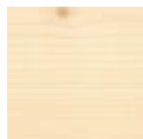
3240 Белое прозрачное