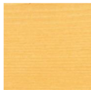
430 Бесцветное шелковисто- матовое

ЦИКЛЕВОЧНАЯ КОМПАНИЯ WWW.1PARKET.RU +7 (495) 545-25-85