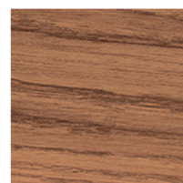
800212 Weathered Oak