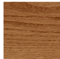
800208 Golden Oak