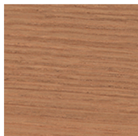
900153 Country White