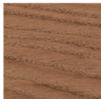
700152 Classic grey