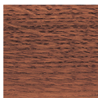
800213 Mesquite Red